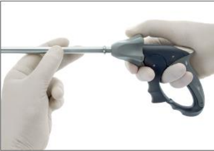
Etape 1: Montage de la tige et de la poignée