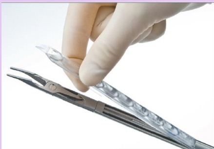
Etape 3: Mise en place de la barrette de clips