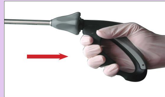
Etape 3: Attraper l'extrémité de la barrette avec le pouce et l'index et tirer délicatement pour retirer la barrette de clips