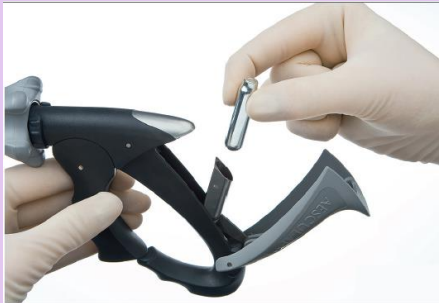
Etape 2: Mise en place de la cartouche de CO 2 opercule vers le haut