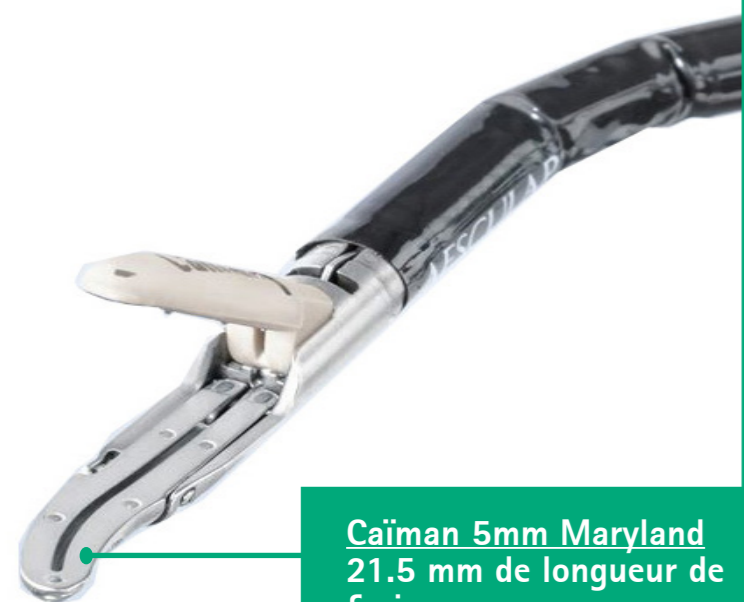
Caiman 5mm Maryland 21.5 mm de longueur de fusion

Les instruments Caiman sont dédiés à la fusion de vaisseaux et tissus de diamètre inférieur ou égal à 7mm en chirurgie laparoscopique et ouverte dans les domaines de la chirurgie digestive, la gynécologie, l'urologie et la chirurgie thoracique.