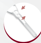
Connecteur anti-torsion à ailettes